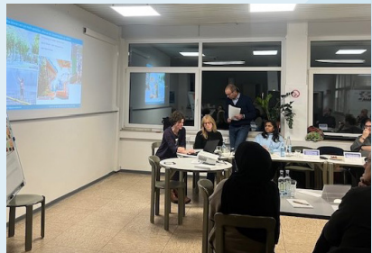
Gebietsbeiratssitzung am 20.11.2024

Interessierte sind herzlich eingeladen, am öffentlichen Teil der Sitzung teilzunehmen.