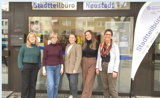
Stadtteilbüro Neustadt Team Dezember 2025

Öffnungszeiten Montag: 9 - 18 Uhr Mittwoch 9 - 16 Uhr Donnerstag 9 - 16 Uhr und nach Vereinbarung