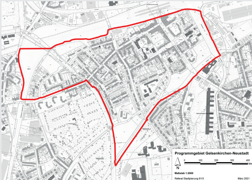
Das Programmgebiet Gelsenkirchen-Neustadt

Im Stadterneuerungsgebiet Gelsenkirchen Neustadt haben Hauseigentümerinnen und Hauseigentümer die Möglichkeit, finanzielle Zuschüsse für die Herrichtung privater Haus- und Hofflächen zu erhalten.