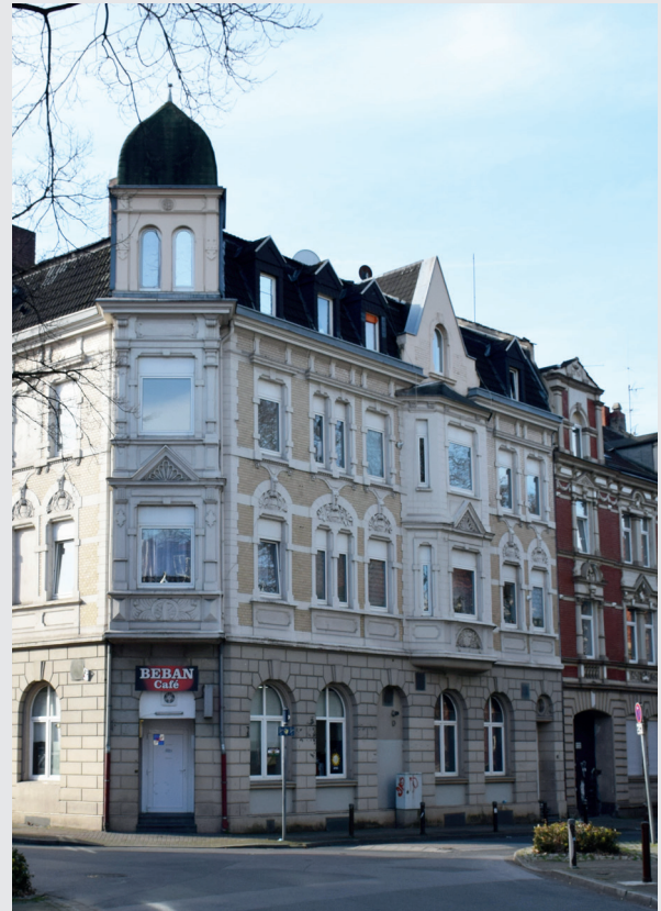
Ein möglicher Kandidat für das Förderprogramm

Vor der Beantragung der Fördermittel steht die Beratung durch die Quartiersarchitektin des Stadtteilbüros. Die Beratung ist für Eigentümerinnen und Eigentümer im Stadterneuerungsgebiet Neustadt kostenlos. Ein Anspruch auf eine Förderung entsteht durch die Beratung nicht.